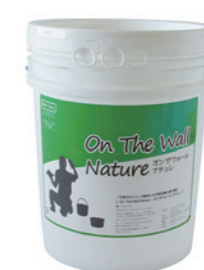
オンザウォール ナチュレ

強度と耐水性に優れ、使う場所を選びません。プレーンの5倍の強度を発揮し、耐水性も高いため、軽い水拭きが可能です。