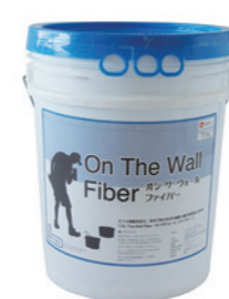
オンザウォール ファイバー

天然成分にこだわり鮮やかな白が木部によく映えます。炭酸カルシウムを主原料とし、様々なミネラル（鉱物）を配合しています。