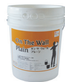
オンザウォール プレーン

天然成分にこだわり鮮やかな白が木部によく映えます。炭酸カルシウムを主原料とし、様々なミネラル（鉱物）を配合しています。