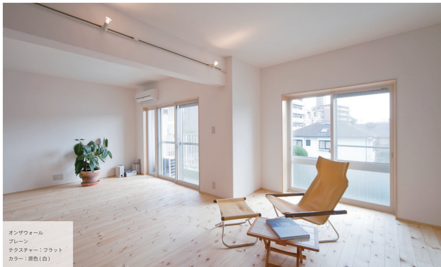
オンザウォール プレーン テクスチャー：フラット カラー：原色（白）

炭酸カルシウムを主原料とし、様々なミネラル（鉱物）などを配合して作られた漆喰系塗り壁材です。天然系塗り壁材の弱点あるクラック防止として、ひび割れしにくい材料が使われています。従来の塗り壁の特徴は維持しつつ、日本の室内環境に寄り添った塗料です。