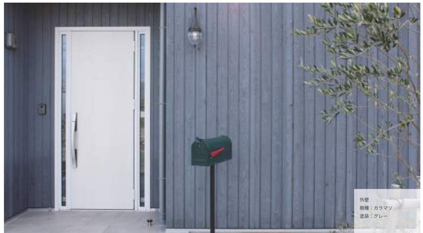
外壁 樹種：カラマツ 塗装：グレー