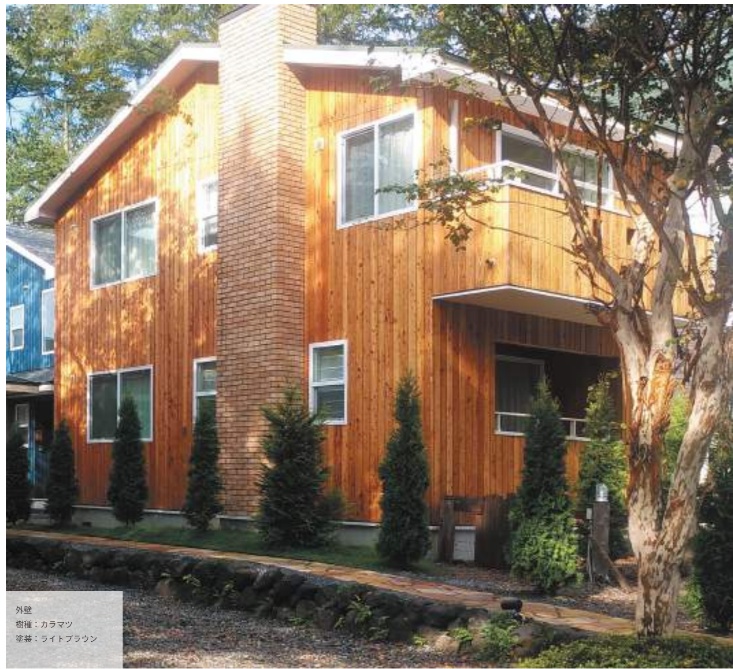
外壁 樹種：カラマツ 塗装：ライトブラウン

※防火構造 / 防火構造とするためには外壁下張材（面材）をモイス（アイカ工業株式会社）で施工してください。 ※カラマツは油分を多く含む樹種のため、使用される環境によってはヤニが発生する場合がございます。