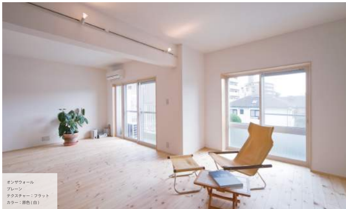
オンザウォール プレーン テクスチャー：フラット カラー：原色（白）

炭酸カルシウムを主原料とし、様々なミネラル（鉱物）などを配合して作られた漆喰系塗り壁材です。天然系塗り壁材の弱点あるクラック防止として、ひび割れしにくい材料が使われています。従来の塗り壁の特徴は維持しつつ、日本の室内環境に寄り添った塗料です。