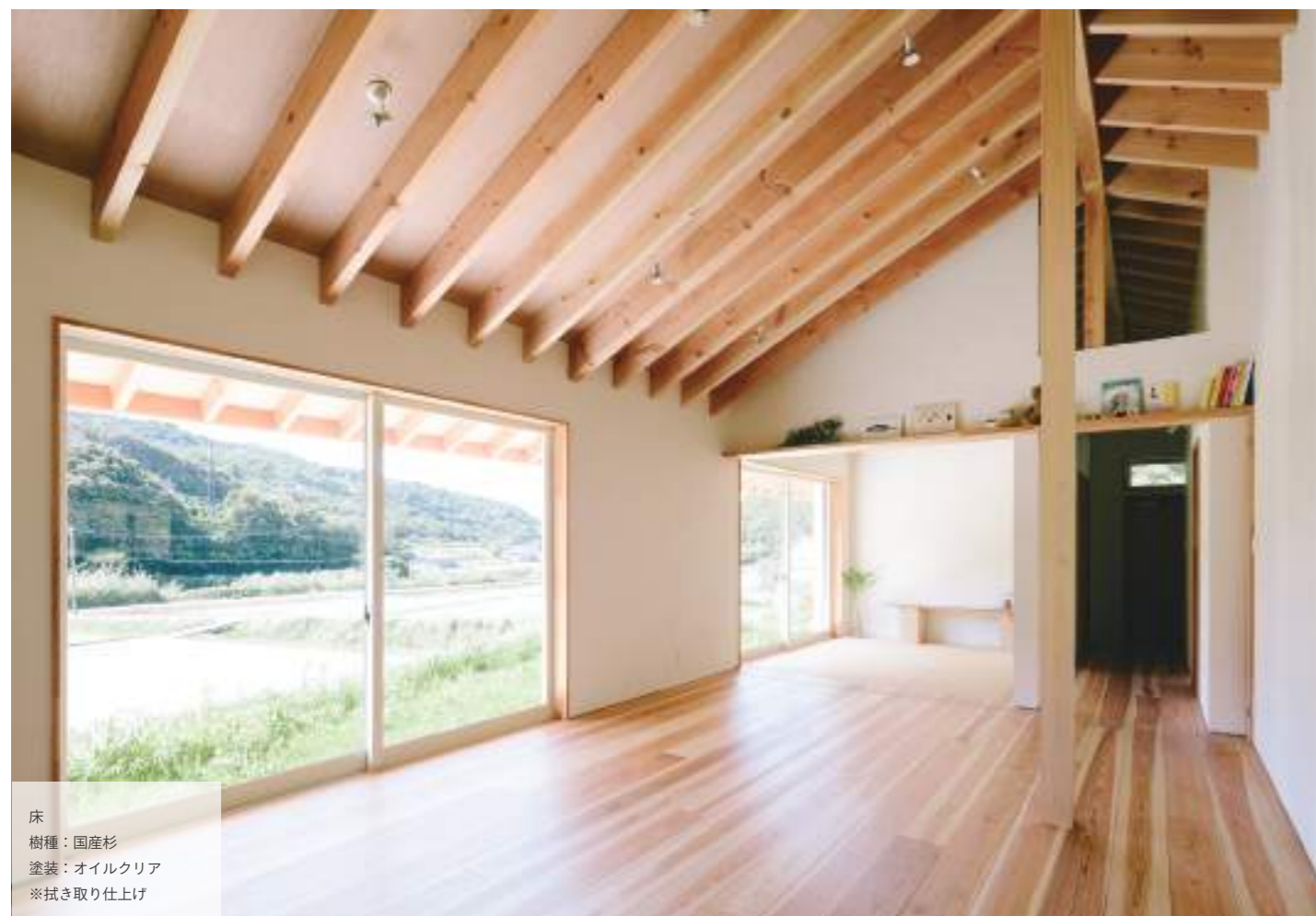
床 樹種：国産杉 塗装：オイルクリア ※拭き取り仕上げ

代表的な杉とひのきは古くから使われている身近な木で、日本の気候と環境に適しています。国産材を積極的に使うことで、地域の活性化や日本の森林を守ることに繋がります。