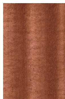
ブラックウォルナット 柾目