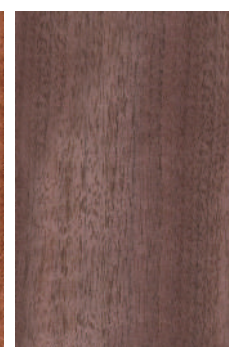
ブラックウォルナット 板目