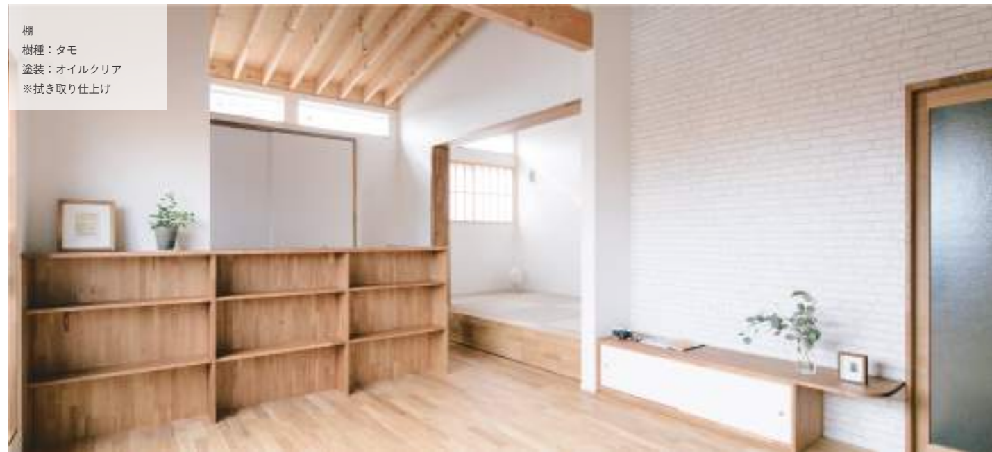
棚 樹種：タモ 塗装：オイルクリア ※拭き取り仕上げ