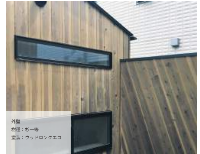
外壁 樹種：杉一等 塗装：ウッドロングエコ